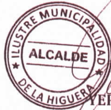
YERKO GALLEGUILLOS OSSANDÓN ALCALDE DE LA HIGUERA

En comprobante y previa lectura, firman las partes al pie y en tres originales, uno para cada parte y otro dirigido al archivo del municipio; ello en señal de expresa aceptación.